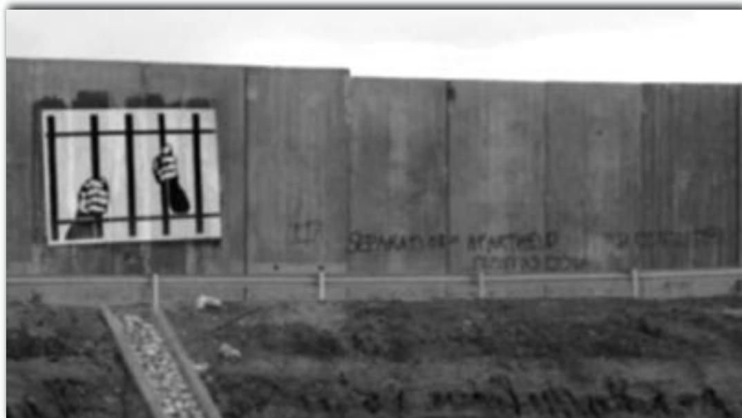
PROTEST: Slagord på muren som omringer Qalqiliya.

Sharon ønsker ikke dette. Det israelske regjeringsskabinettet er det mest høyreekstre i staten Israels historie, og preget av overmot etter krigen mot Irak. 1 For han er det viktigere at den israelske «sikkerhetsmuren» bygges ut og at de ulovlige bosettingene fortsetter å utvides, enn å unngå at israelske sivile sprenges i busser i Tel Aviv og Jerusalem. Sharons strategi er preget av en idé i det israelske samfunnet om at USAs seier over Irak gir rom