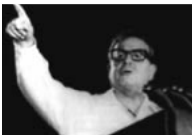
President Salvador Allende.

Et stort antall kamerater som tilhørte «det revolusjonære venstre», MIR (Den revolusjonære venstrebevegelsen), PCR (Det revolusjonære kommunistiske partiet) og andre mindre grupper, ga eksempler på modig motstand mot det fascistiske diktaturet. Sjøl om revisjonistene hevdet at disse gruppene hadde ansvaret for å provosere fram kuppet, var det faktisk der en fant den mest konsekvente innsatsen for å finne en revolusjonær vei ut av krisa i den borgerlig-demokratiske formen for kapitalistisk utbytting i Chile før 11. september 1973, om en da ser bort fra deres ideologiske og politiske feil.