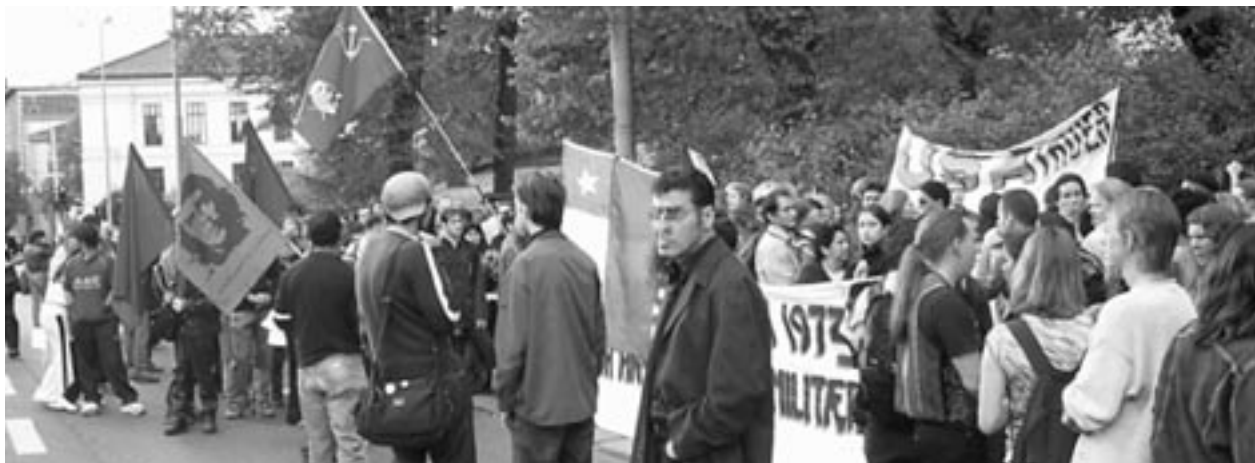
30-årsdagen for Pinochet-kuppet ble markert den 11. september – her foran den amerikanske ambassaden i Oslo.

Endelig er viktig å påpeke at «det ekstreme venstre» har fått skylda for kuppet i mange år. Mens revisjonismen knesatte sin formløse «politikk for et folkelig opprør», som aldri satte seg noe annet mål enn