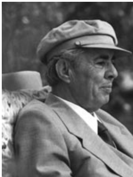
Enver Hoxha (over) kritiserte skarpt revisjonistenes medansvar for det kontrarevolusjonære jentakuppet.

Først må det sies at perioden under Allendes regjering ikke er en periode som enkelt lar seg viske ut fra livet til det chilenske folket eller fra historien til Latin-Amerika som helhet. Unidad Popular-regjeringa vedtok en serie åtgjerder og satte ut i livet en rekke reformer i samsvar med kravene og ønskene til folkets breie masser